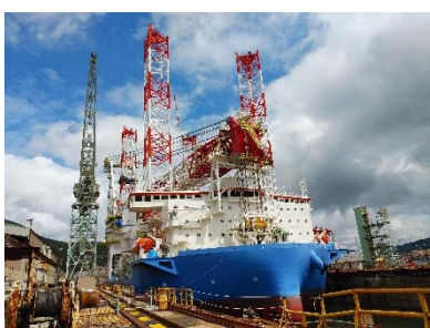
国内最大規模の SEP 船